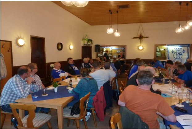
Mit Vertretern aus 36 Fanclubs war die Versammlung gut besucht