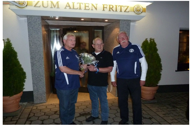
Der frisch gewählte Bezirksleiter nimmt Gratulationen entgegen

Am Samstag, den 25. August , hatte der Fanclub seine Mitglieder und ihre Familien zu einer zünftigen Grillparty eingeladen. Bei herrlichem Wetter fanden sich ca. 80 Personen in der, von den Sportfreunden Hüingsen zur Verfügung gestellten, OBO-Arena ein. Für reichlich Kurzweil sorgte ein Einlagespiel der Alten-Herren-Mannschaften der Sportfreunde Hüingsen gegen eine Auswahl des BSV Lendringsen und Grün-Weiß-Menden. Zudem wurden neun Mitglieder von Blau-Weiß-Hönnetal für langjährige Mitgliedschaft geehrt.