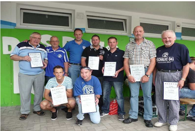
Stolz präsentieren sich die geehrten Mitglieder zum Gruppenfoto

Am Samstag, den 25. August , hatte der Fanclub seine Mitglieder und ihre Familien zu einer zünftigen Grillparty eingeladen. Bei herrlichem Wetter fanden sich ca. 80 Personen in der, von den Sportfreunden Hüingsen zur Verfügung gestellten, OBO-Arena ein. Für reichlich Kurzweil sorgte ein Einlagespiel der Alten-Herren-Mannschaften der Sportfreunde Hüingsen gegen eine Auswahl des BSV Lendringsen und Grün-Weiß-Menden. Zudem wurden neun Mitglieder von Blau-Weiß-Hönnetal für langjährige Mitgliedschaft geehrt.